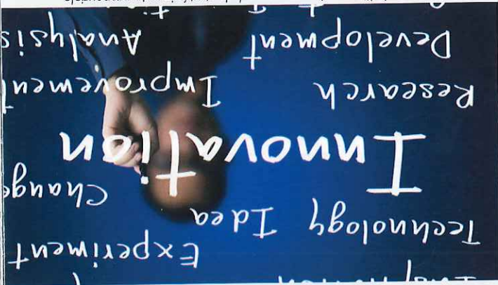
Le management de l'innovation, au cœur de la stratégie entrepreneuriale

Mettre en place un management de l'innovation, au sein de l'entreprise, est possible grâce à une formation proposée par la HES-SO Valais/Wallis, en partenariat avec la HEIG-VD, via son « MAS HES-SO en Quality & Strategy Management » (MAS QSM — www.masterQSM.ch ). Durant cette